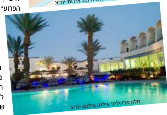
מלון פריוליג אילת

ואם זה לא מספיק, ביום שבת (24/11) לצד מופעי החבורות, יזכו החברים להטבות מיוחדות בשלל אטרקציות תיירותיות בעיה, עליהן נרחיב במגזין הבא ובסמוך לפתיחת הפסטיבל.