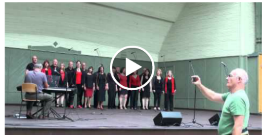
המקהלות הישראליות באולימפיאדת ריגה 2014

ה פעם העיר המארחת היא מגדבורג, בירת מדינת סקסוניה אנהלט - עיר בעלת היסטוריה רבת שנים, הממוקמת בלב ליבה של גרמניה, שתארח את המשחקים המוסיקליים בין התאריכים 5-12/7/15