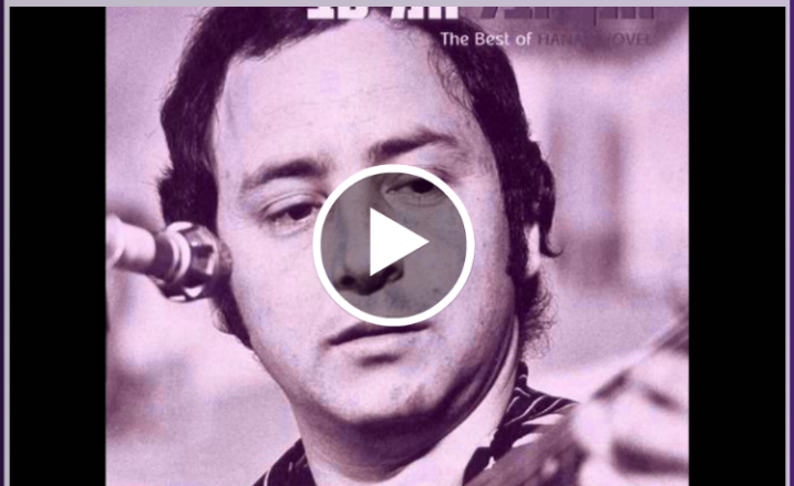
חנן יובל בביצוע השיר "השמש תעבור עליי"

"אני מכיר ומוקיר את זמרי החבורות והמקהלות ויודע איזו עבודה נפלאה נעשית במיל"ה. אין לי ספק שזה יהיה כיף גדול להופיע מול קהל שכזה".